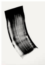
Reference 16 by Phil Chang. Black on Paper. 2013