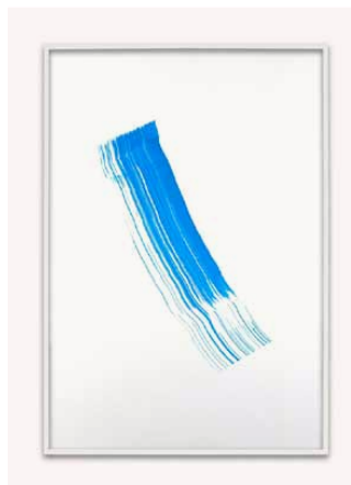
Reference 21 by Phil Chang. Blue on Paper. 2013