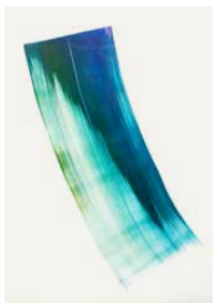
Reference 14 by Phil Chang. Green and Cyan on Paper. 2013