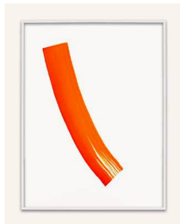
Reference 22 by Phil Chang. Red and Orange on Paper. 2013