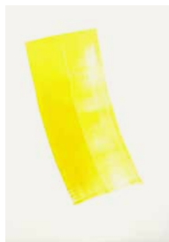
Reference 20 by Phil Chang. Yellow on Paper. 2013