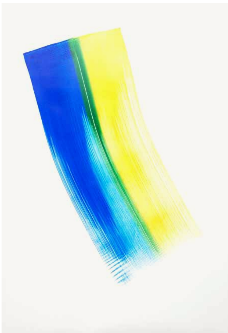
Replacement Ink for Epson Printers (Cyan and Yellow on Epson Premium Glossy Paper, 2013)