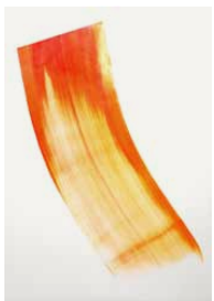
Reference 18 by Phil Chang. Red and Orange on Paper. 2013